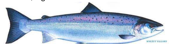
Bilde: Nygått villaks, hunn